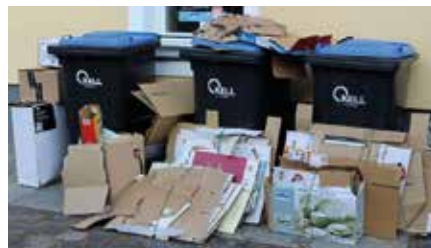
Solche Ablagerungen werden zukünftig nicht mehr abgeholt.

Die KELL GmbH informierte vor Kurzem darüber, dass nicht ordnungsgemäß bereitgestellte Nebenablagerungen von Pappen und Kartonagen zukünftig als solche gekennzeichnet und von der Entsorgung ausgeschlossen werden. In einer Klarstellung betont das Unternehmen nun, dass sich diese Vorgehensweise insbesondere auf die seit Jahren zunehmende unsachgemäße Bereitstellung von Pappen und Kartonagen aus dem „gewerblichen Bereich“ und nicht vorrangig auf die derzeit vermehrt anfallenden Abfälle in den Haushalten des Landkreises beziehe. Fallen im Ausnahmefall (wie z.B. in der derzeitigen Pandemie) bei sonst ausreichendem Behältervolumen mehr Pappen und Kartonagen an, werden diese selbstverständlich weiterhin innerhalb der Regelentsorgung mitgenommen. Voraussetzung dafür ist allerdings,