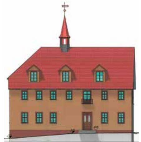
Der fertig sanierte Ratskeller wird wieder das prägnante Türmchen auf dem Dach haben. Skizze: Planungsbüro Kewitz

Die Vergaben für die Arbeiten im 2. Bauabschnitt, in welchem die Gebäudehülle mit Dach, Dachstuhl, Fassade und Fenster instandgesetzt werden, waren bereits mit Stadtratsbeschlüssen am 21. Juli und 29. September 2020 erfolgt. 🌹