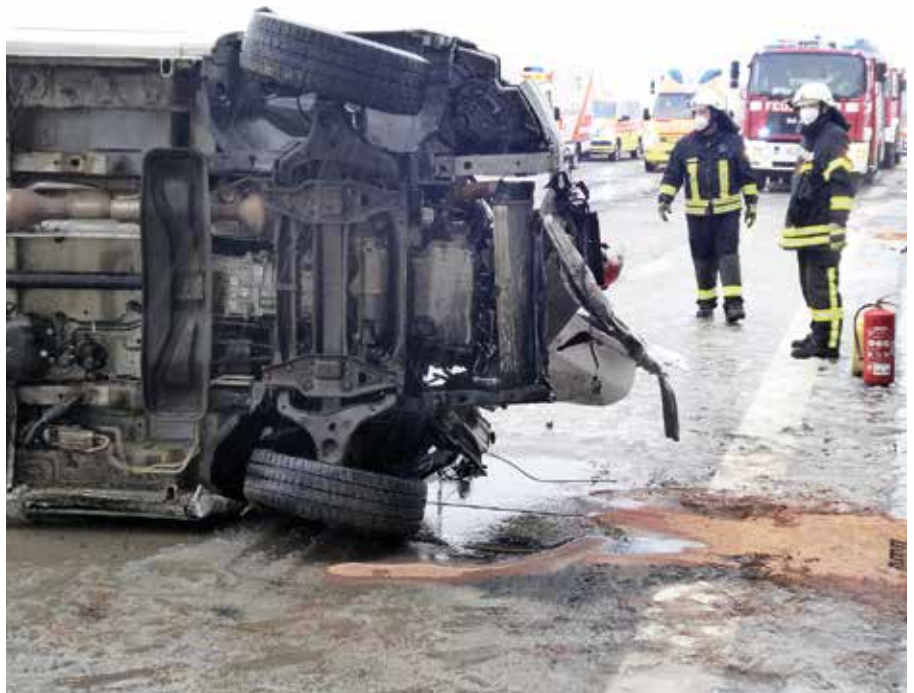
Gemeinsam mit den Naunhofer Kameraden hatten die Brandiser einen Einsatz auf der Autobahn 38.

Am nächsten Tag hatten wir erneut drei Einsätze zu absolvieren. Am Nachmittag hatten wir zwei Alarmierungen zu auslaufenden Betriebsstoffen auf der Straße. Dieser Einsatz dauerte über drei Stunden mit 16 Einsatzkräften, um die Gefahr, die sich über 6 Kilometer durch das Stadtgebiet zog,