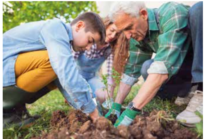
An zukünftige Generationen denken: Nachhaltigkeit spielt auch bei Versicherungsleistungen eine wachsende Rolle.

Auch die Regulierung bei Haftpflichtschäden lässt sich nachhaltig gestalten. So stehen Mehrleistungen für einen besonders umweltfreundlichen Schadenersatz zur Verfügung. Beim Ersatz spielen zudem unabhängige Prüfzeichen wie Fairtrade oder Umweltsiegel eine wichtige Rolle. Darüber hinaus haben der Versicherungskunde und der Geschädigte Anspruch auf eine kostenlose Nachhaltigkeitsberatung. Die mittelständische Versicherungsgesellschaft arbeitet für die