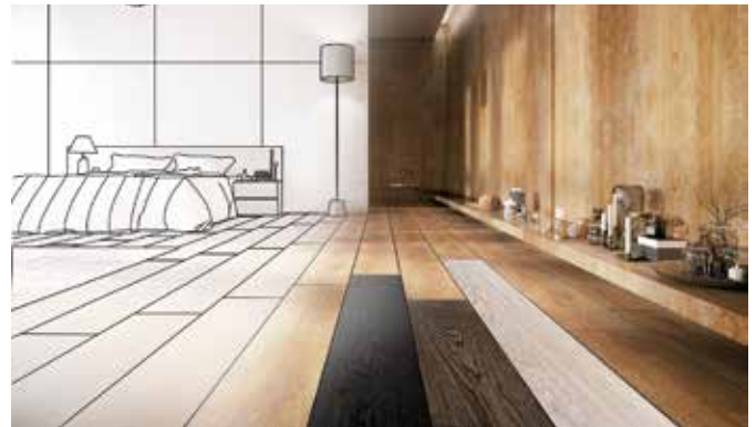
Holzart, Farbe und Verlegemuster des Fußbodens sollten sowohl auf die Raumgröße als auch auf den persönlichen Einrichtungsstil abgestimmt werden. Es empfiehlt sich, schon in der Planungsphase das Gespräch mit einem von Bona empfohlenen Handwerker zu suchen.