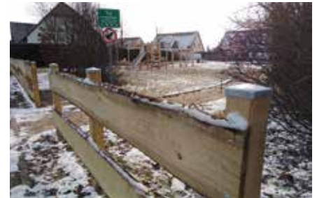
Der neue Holzzaun am Spielplatz Ahornweg in Beucha.