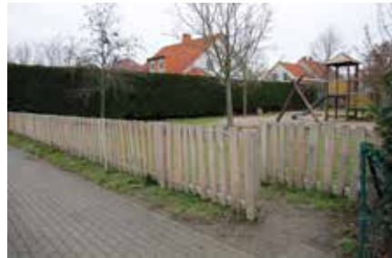
Der Spielplatz am Wildbirnenweg hat zur Leipziger Straße hin einen neuen Holzzaun bekommen.

Der Zaun am Spielplatz im Brandiser Wildbirnenweg war ebenfalls so marode, dass er ausgetauscht werden musste. Hier wurde ein Holzzaun errichtet, den der Hersteller Ziegler „Märchenzaun“ genannt hat. 🌹