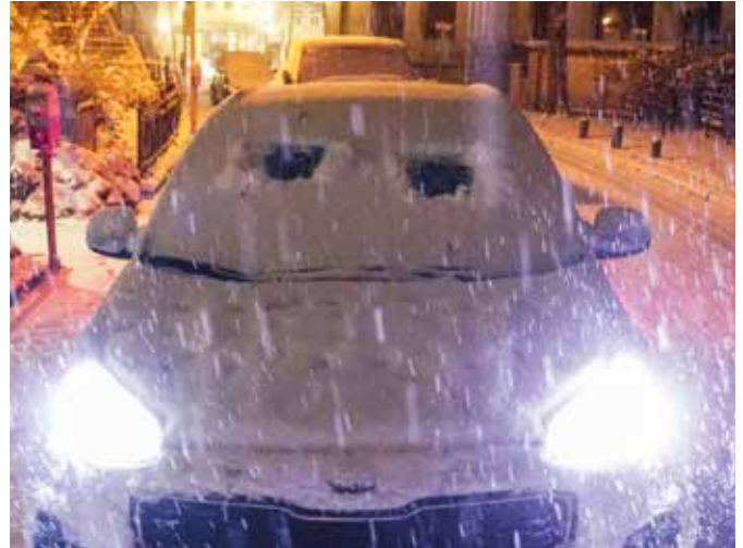
Kleine Gucklöcher sehen lustig aus. Doch im Straßenverkehr kann mit ihnen schnell der Spaß vergehen.