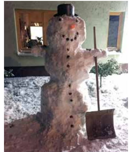
Gemeinsam bauten Kinder und Erzieher einen Schneemann.

schichte des „Radieschentheaters“, die sich alle als Video (über unsere Homepage) anschauen konnten. Hierbei ging es um einen Mann, der verletzt auf einer Straße lag und Hilfe brauchte. Mehrere Passanten kamen vorbei, ohne zu helfen. Am Ende half der, von dem es niemand erwartet hatte. Selbstlos, ohne nach dem Preis zu fragen. Die Geschichte entstammt der Bibel, ist heute aber noch genauso aktuell. Auch wir sind herausgefordert, zu helfen – jeder mit dem, was er hat. In Verbindung mit der Geschichte gab es einen Bilderwettbewerb – wer wollte, durfte ein Kunstwerk zum Theaterstück