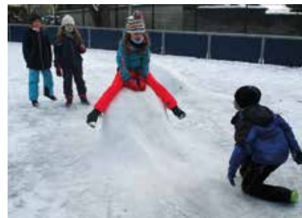
Mit dem Schnee bauten die Hortkinder kleine Rutschen.

ruhe konnte sich individuell vom lehrreichen Vormittag erholt werden. Die zweiten Klassen ließen ihrer Fantasie freien Lauf, mit Hörspielen und Musik entspannten sie sich und tankten neue Kraft. Auch hier wurde fleißig gebastelt und gewerkelt. Lustige Schneemänner erfreuten uns ebenso wie die bunten Feuerwerk-Kratzbilder. Im Freispiel wurde gemalt, mit Lego gespielt und wer sich einmal ausruhen wollte, konnte seine Seele baumeln lassen. Die dritten Klassen sprachen viel miteinander und malten im Freispiel tolle Bilder: eigene Kreationen sowie Ausmalbilder. Bei Gesellschaftsspielen wie „UNO Extreme“ und „Wer bin ich“ hatten sie viel Spaß. Neben den individuellen Spielen konnten die Kinder mit Farbe malen, aus einer „Acht“ einen Pinguin entstehen lassen und sich nach den Klängen der neuesten Musik bewegen. Die Arbeit mit Wolle brachte aber genauso viel Begeisterung. Die vierten Klassen hatten viel Freude an Handarbeiten. So entstanden lange Wollbänder beim Fingerstricken, tolle Formen und Bilder bei der Fadengrafik sowie bunte Freundschaftsbänder.