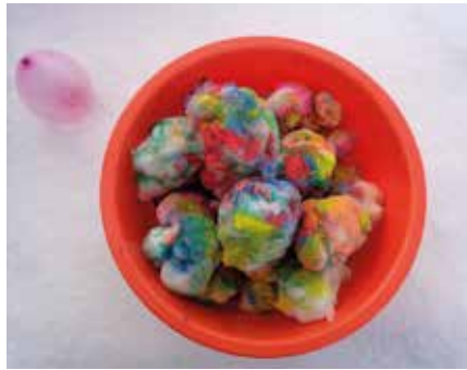
Bunt wurde es mit farbigem Schnee.

Ungewohnt leise begann das neue Jahr in der Kinderstube. Nur wenige Kinder durften aufgrund der aktuellen Lage die Kita besuchen... Die Kinder, aber auch wir Erwachsene, vermisten seitdem Freunde, den fröhlichen Trubel und auch manche Abläufe unseres normalen Alltags. Wie gut, dass uns da immer wieder der Winter ablenkt und so manche Freude bereitet. Ob beim Rodeln, Schlittenfahren oder einer lustigen Schneeballschlacht, alle freuten sich an der weißen Seltenheit. Als das dann irgendwann nicht mehr spannend genug war, haben wir den Schnee einfach bunt eingefärbt und schon gab es wieder viele neue Spiel- und Experimentiermöglichkeiten. Während sich die Kinder draußen vergnügten, wurde es zunehmend auch im Haus lauter. Es begann zu klopfen und zu bohren, zu hämmern und zu rumoren und das aus den verschiedenen Ecken des Hauses. Was da wohl passiert ist? Das wird nicht verraten! Nur so viel: Besonders die Bären-Kinder und unsere Kinder mit besonderem Förderbedarf (Integrativkinder) dürfen sich auf eine tolle Überraschung freuen! Um alle Kinder, die zuhause bleiben müssen, ein wenig mit hineinzunehmen, gab es im Januar eine Ge-